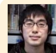
大学院理工学教育部 化学専攻 修士課程2年

4年間の大学生活でより化学に深くかかわれるので、化学に興味のある人は一緒に勉強しましょう。