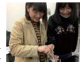
フォトニック結晶の作製

溶液に強いレーザーパルス照射することによって、極端に平衡状態から離れた「強度非平衡状態」を作り出すことができます。このような極限状態を、溶液化学やレーザー光化学、散乱理論、顕微観察などの手法を用いて明らかにしようとしています。医学・薬学・光学的应用についても検討しています。