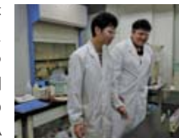
発光性錯体の合成

新しい構造・物性・反応性を持つ金属錯体の合成を行っています。金属イオンは配位子と組み合わせることにより、様々な構造や性質を持つ錯体となります。現在は、発光性を示す錯体と刺激に反応して構造や性質を変化させる錯体の合成に加え、二酸化炭素・酸素・窒素などの小分子を活性化化する錯体の開発を進めています。