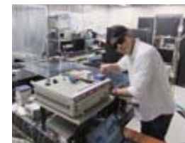
フェムト秒レーザー分光測定

分光法や計算化学の方法を用いて電子励起状態の性質や反応に関する研究を行っています。最近、新しい発光素子や光-電気変換素子として有機-無機複合分子が注目されています。このような分子の励起状態についての基礎研究は、光機能メカニズムの解明や新規分子設計などの応用研究へと発展できます。