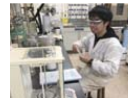
機能性化合物の合成

自然界に存在しない有機化合物や有機金属化合物をあらたに設計・合成し、それらも興味深い性質や機能、構造、反応性について実験と理論の両面から調べています。とくに、外部刺激に反応する化合物、半導体材料やアモルファス、ホウ素を含有する機能性化合物について研究しています。