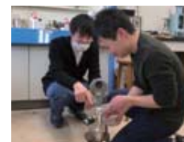
触媒表面に吸着した物質の定量

触媒について研究しています。触媒は化学薬品などを合成製造する際に欠かせないものであり、また最近では、環境触媒としてNOxや悪臭の除去などにも幅広く使われています。このような触媒の働き、活性発現機構などについて、物理化学的手法を用いて、基礎的理論的研究から実用的研究まで幅広く研究しています。