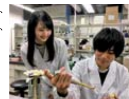
遺伝子工学によるRNA合成

RNAはDNA類似の遺伝子分子として、また蛋白質に匹敵する生体触媒分子として、生命活動で多彩な役割を担う生体高分子です。RNAは化学と生命科学を跨ぐ基礎研究の対象と同時に、医療や創薬への応用からも高い注目を集めています。私たちは生化学解析と人工創製を通じRNAの多彩な機能の秘密と可能性を探究しています。