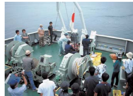
富山湾海水の採取

辺海域の海底熱水鉱床探査技術の開発を通して、環境に配慮したエネルギー・鉱物資源の開発を目指し、持続的な経済発展にも貢献いたします。