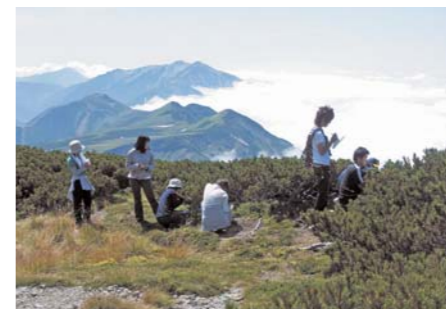
立山での野外実習

と訪花昆虫の関係についての研究、立山における地球環境変動の影響についての研究などを行っています。哺乳動物や寄生虫などの野生動物の生態や保全についても、研究を進めています。