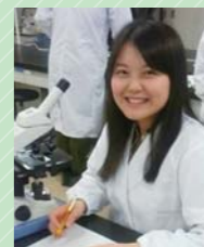
生物圏環境科学科2年

生物圏環境科学科は、分析化学、生物学、地球科学などあらゆる分野の視点から、私たちを取り巻く自然環境について学び、議論しています。1年生では、一般教養を身に付ける教養科目を主に受講しますが、2年生になると専門科目が増え、学生実験も始まります。実験では、実際に川などに行き、水や土壌を採取し、その試料に含まれる成分濃度を測ったり、汚染物質がどの程度含まれているのかなどを調査します。また、海や川にどのようなプランクトンがいるのか観察し、池、空気中、水道水、食品から採取した細菌の培養も行います。