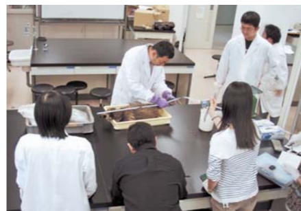
野生動物(タヌキ)の解剖