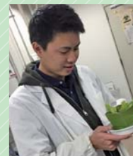
生物圏環境科学科4年

大学生活は、自分のやりたいことや挑戦したいことを実現できる絶好の機会です。今ここでしか経験できない、学べないことに積極的に取り組んで学生生活を楽しんでください。